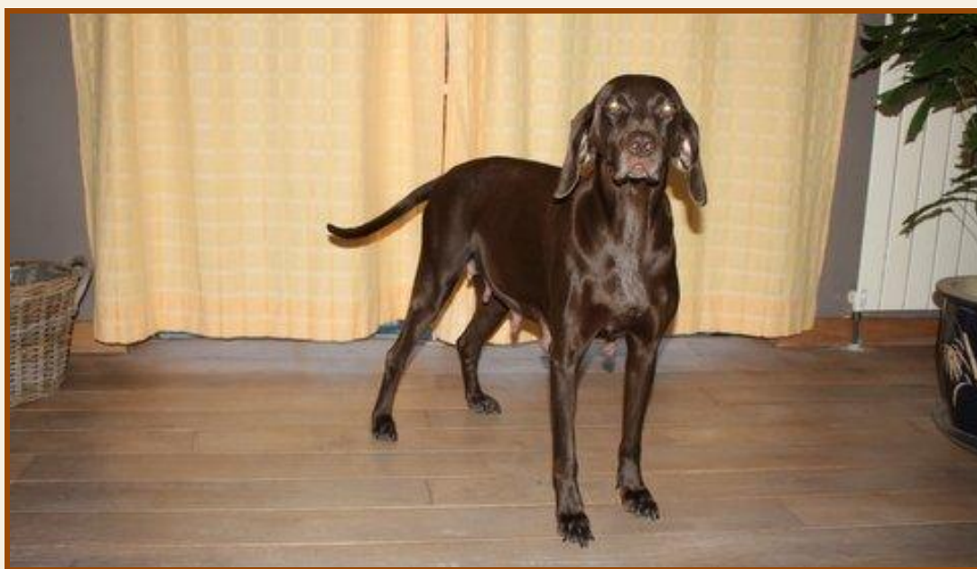
Luna, 11 maart 2013

Vanaf woensdag gaan we Luna ook extra in de gaten houden en temperaturen. Zodra haar temperatuur een graad daalt voor een korte periode, en daarna weer rap oploopt, dan is de kans groot, dat de bevalling zich aandient. Al met al.....wij zijn er klaar voor, jullie hopelijk ook, nu Luna nog (haha)!!