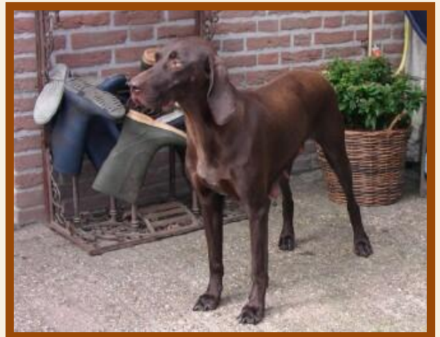
Luna, zaterdag 26 april 2008